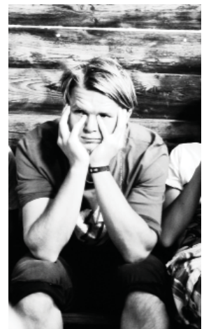
Generál Jonny si neví rady s podpatky

Podarí se Jonnymu obnovit morálku zdecimovaného pluku?